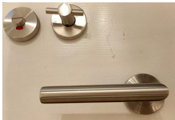
Vrij- en bezetslot

Kozijnen en deuren van hout. De deuren worden als vlakke, stompe designdeuren uitgevoerd. Zowel kozijnen als deuren zijn wit gegrond. In verband met de nodige ventilatie is een naad onder de deur aanwezig. Deuren worden voorzien van beslag. De deuren van het toilet en badkamer worden uitgevoerd met een vrij- en bezetslot. De deur van de meterkast is voorzien van een kastslot. De overige binnendeuren worden uitgevoerd met een loopslot.