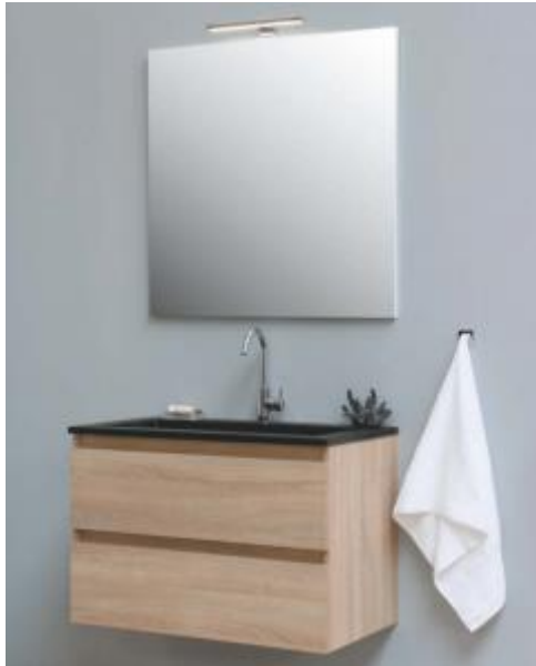
Wastafel met spiegel

Solid Promo o.g. badmeubelset 80 cm met designplug, 2 lades, spiegel en ledverlichting (middels touch schakelaar). Wastafelkraan Hotbath Laddy, verchromd.