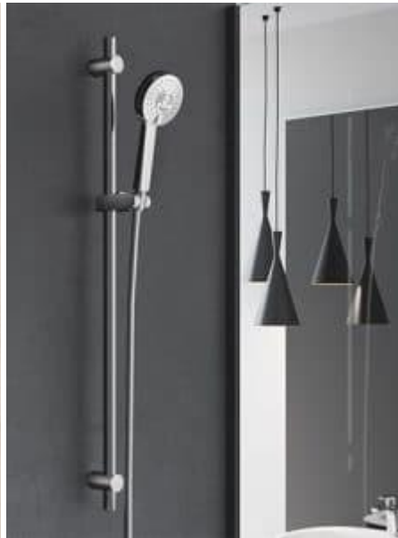
Glijstangset met handdouche